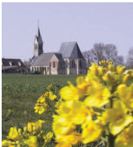
Vue d'Ecuville et de son église.

la petite route goudronnée (6) , s'engager à droite pour atteindre le calvaire le long de la D76 (7) . Au croisement du calvaire tourner à droite, puis presque immédiatement après, emprunter la rue de gauche (8) se poursuivant dans la plaine. Suivre cette voie toujours tout droit. Traverser la D24 (Attention circulation rapide) (9) . Au bout du chemin virer à gauche (10) . Aux premières habitations d'Ecuville, remonter la ruelle de droite (11) . Derrière les jardins particuliers (12) , suivre le tracé de l'ancienne voie ferrée sur la gauche. Continuer dans cette même direction jusqu'au bord de la D76 (13) . Franchir la route et emprunter le chemin longeant l'ancienne gare . De retour sur une petite route (14) , aller à droite jusqu'au Parc de la Fontaine Cailleux (15) (désormais Fontaine Saint Jean). Au niveau du Parc, tourner à gauche et traverser l'aire de détente pour rejoindre le sentier de la Fontaine Lematte (16) . A l'extrémité de la sente partir à droite au niveau de la ruelle du Prieuré (17) . Arrivé au Stop le long de la D24 (18) , bifurquer à gauche pour regagner la place communale (1) .