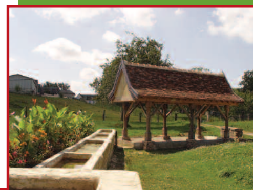
Lavoir de la fontaine Sorel.