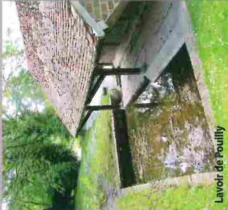
Lavoir de Pouilly