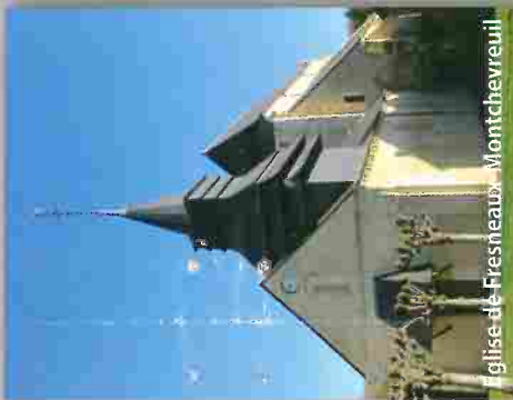
Eglise de Fresneaux-Montchevreuil