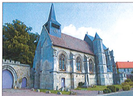
Église de Folleville

s'ouvrirent laissant voir un fond marin tapissé de coquilles qui prirent ainsi le nom du saint.