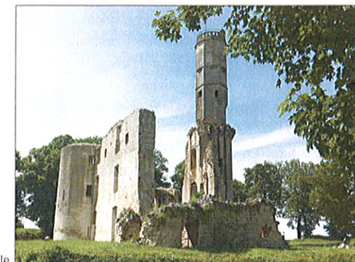
Château de Folleville

RFN31-2 - Entretien des sentiers et rédaction des textes : FFRandonnée 80. Le nom RandoFiche ® est une marque déposée, nul ne peut l'utiliser sans l'autorisation de la Fédération française de la randonnée pédestre © FFRandonnée 2018.