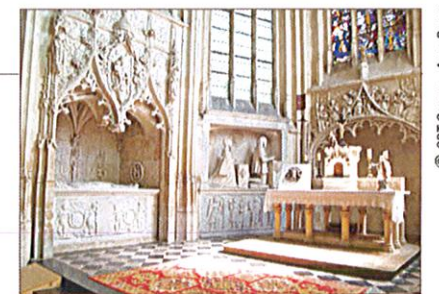
Église de Folleville

Riches d'histoire et finement décorée, l'église de Folleville présente deux parties d'origines différentes. La nef, du xv e siècle, est dédiée à saint Jacques le Majeur dont une statue en pierre polychrome, typique avec la coquille, orne le mur près de la chaire où prêcha saint Vincent de Paul. Un des vitraux rappelle cet évènement. La voûte en chêne provient d'une carène de navire et une vasque baptismale en pierre et marbre de Carrare a servi au baptême du fils d'un seigneur de Folleville, dont la marraine n'était autre que Marguerite de France, future épouse