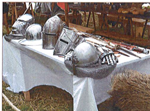
Aux Médiévales de Folleville

visiteurs ainsi que l'église voisine. Chaque année s'y déroule les médiévales le dernier week-end du mois d'août (marché, artisans, musique traditionnelle, taverne, chevaliers...). Ainsi, tout au long de la journée, en famille, on découvre le Moyen Âge de manière conviviale.