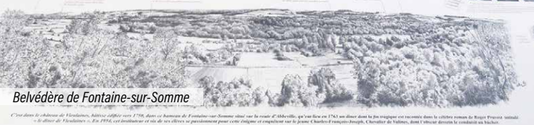
Belvédère de Fontaine-sur-Somme

C'est dans le delta de l'Andouane, à l'embouchure de l'Yonne, dans le Bassin de Fontaine-sur-Somme, au sud de l'Abbeville, que s'est formé en 1764 un diable dans les nuages qui s'élève dans le ciel comme le Mont Saint-Michel. C'est le diable de Fontaine-sur-Somme. En 1776, cet édifice est construit par le jeune Charles-François de Longpré, Comte de Valenciennes, dans l'intention de rendre le comté de Valenciennes invulnérable.