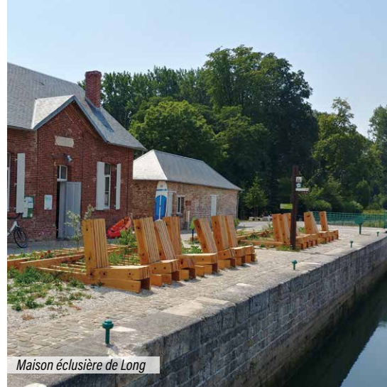
Maison éclésièrre de Long