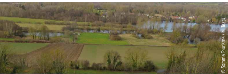
Les marais et étangs de Fontaine-sur-Somme