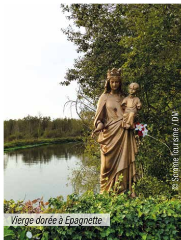
Vierge dorée à Epagnette

C'est dans le delta de l'Andouane, à l'embouchure de l'Yonne, dans le Bassin de Fontaine-sur-Somme, au sud de l'Abbeville, que s'est formé en 1764 un diable dans les nuages qui s'élève dans le ciel comme le Mont Saint-Michel. C'est le diable de Fontaine-sur-Somme. En 1776, cet édifice est construit par le jeune Charles-François de Longpré, Comte de Valenciennes, dans l'intention de rendre le comté de Valenciennes invulnérable.