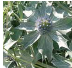
Panicaut des dunes

En revanche, des passereaux, écureuils et chevreuils s'y plaisent.