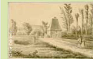
Chapelle Saint-Milfort , (c) BM Abbeville, coll. Macqueron d'après D. de St-Amand (XVIII ème siècle).

Le nom de la bouvaque proviendrait de bos , le bœuf, et de vacca , la vache. Cette appellation rappelle qu'au Moyen-âge on y faisait paître les troupeaux. On trouve les traces d'une seigneurie dénommée Bouvaque dès la deuxième moitié du XV e siècle. La famille Maupin, qui en était détentrice, donna plusieurs mayeurs (maires) à la Ville et fit construire la petite chapelle dédiée à Saint-Milfort qui se situe toujours non loin du parc.