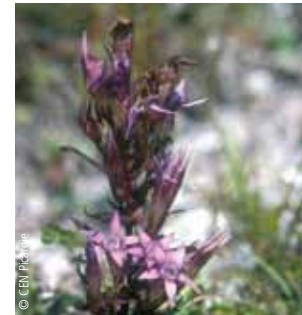
La Gentiane d'Allemagne : Sur le coteau bordant la vallée et les nombreux talus, la Gentiane d'Allemagne fleurit à la fin de l'été. Ses fleurs mauves finement découpées flattent l'œil du promeneur.

taille des branches pour le bois de chauffage qui leur a conféré leur silhouette si particulière. L'enclos que vous apercevez entre les mois de juin et d'octobre sur votre gauche permet de maintenir hors de portée de l'appétit des brebis le Sysimbre couché, une plante particulièrement rare en Picardie et protégée à l'échelle européenne.