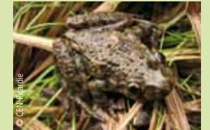
Le Péloodyte ponctué : Les batraciens sont d'excellents indicateurs de la qualité des zones humides. Plusieurs espèces, dont le Péloodyte ponctué, cohabitent sur le site.

Quelques 10 espèces d'amphibiens ont été recensées en vallée d'Acon : crapauds, grenouilles et tritons s'y ébattent. C'est la complémentarité des milieux qui leur assure des conditions de vie favorables : milieux aquatiques pour la reproduction, herbages, éboulis et zones boisées pour se nourrir, s'abriter et hiverner. Le Triton crêté et le Péloodyte ponctué sont les espèces les plus remarquables.