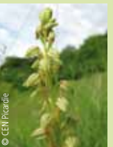
L' Orchis homme-pendu

D'avril à novembre, vous croiserez des « débroussaillieurs » : des bovins nantais, espèce menacée, et des chevaux Fjords en pâturage, ainsi que des moutons sur le coteau. Bien entendu, leur présence est organisée de manière à entretenir sans perturber le développement des espèces végétales.