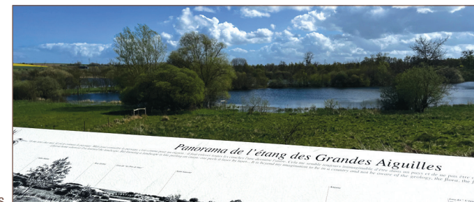
Panorama des Grandes Aiguilles

• Comité Somme : https://somme.ffrandonnee.fr/