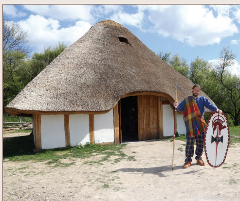
Habitat gaulois, à Samara

Unique en Europe, Samara présente les quatre grandes périodes de la Préhistoire depuis le Paléolithique jusqu'à l'Âge du Fer. Explorez la partie « animations et reconstitutions » du parc où se trouvent les habitats reconstitués à partir de fouilles archéologiques réalisées en Picardie. Découvrez aussi l'arboretum et les soixantes espèces forestières avec, au centre, son labyrinthe végétal.